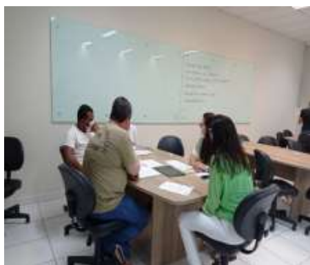
Capacitação – Segregação de Resíduos