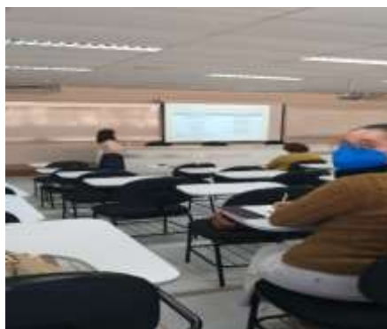
Reunião Médica/Enfermagem – Atenção Básica de Saúde – DRS V