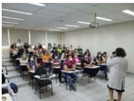
Encontro de Gestores Municipais – DRS V