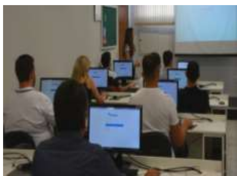
Capacitação de Líderes e Colaboradores Hospital de Amor