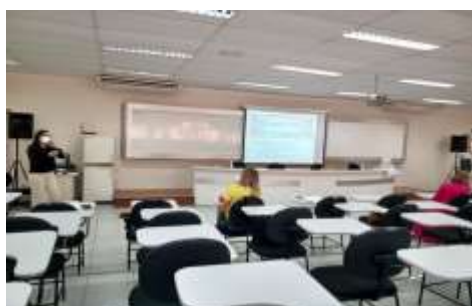
Encontro de Gestores Municipais – DRS V