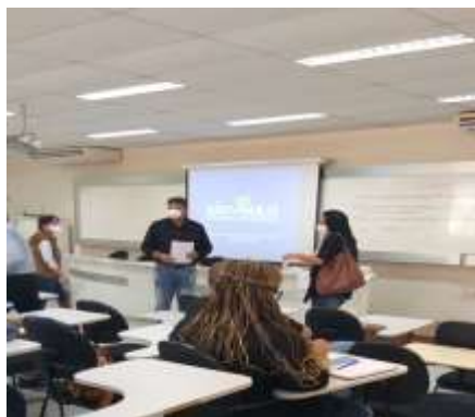
Reunião Médica – Atenção Básica de Saúde (região DRS V)