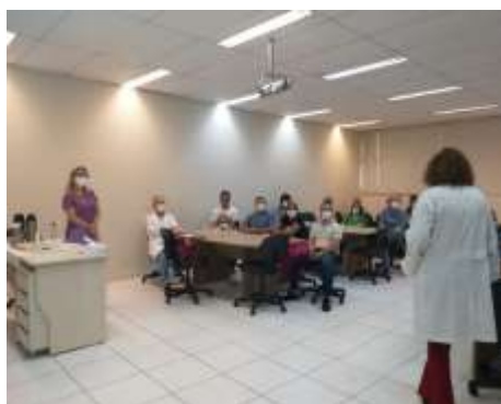
Encontro de Gestores Municipais – DRS V