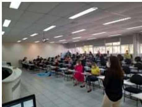
Reunião: Núcleo de Educação Permanente e Humanização