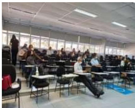
Reunião com Interlocutores de Educação Permanente