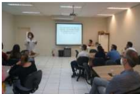
Encontro de Gestores Municipais – DRS V