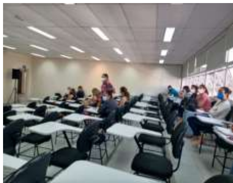
Encontro de Gestores Municipais – DRS V