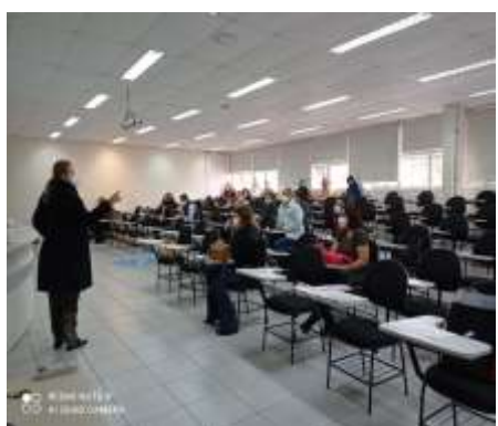
Encontro de Ostromizados