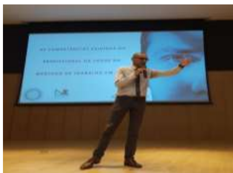
Programa de estratégia de Saúde da Família – Barretos