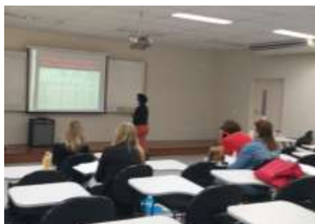
Capacitação – Doença Pulmonar Obstrutiva Crônica (DPOC)