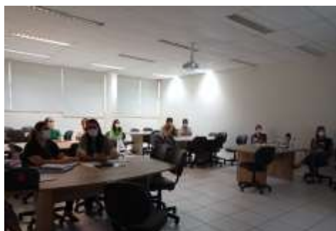
Encontro Gestores Municipais – DRS V