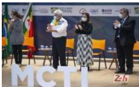
Entrega Medalhas – 23ª Olimpíada Brasileira de Astronomia