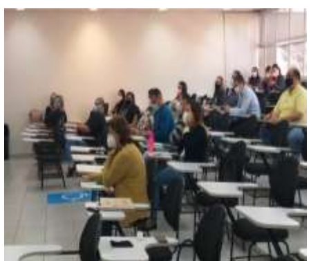
Reunião Técnica sobre Atenção Básica da Saúde