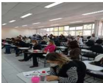
Encontro Saúde da Mulher